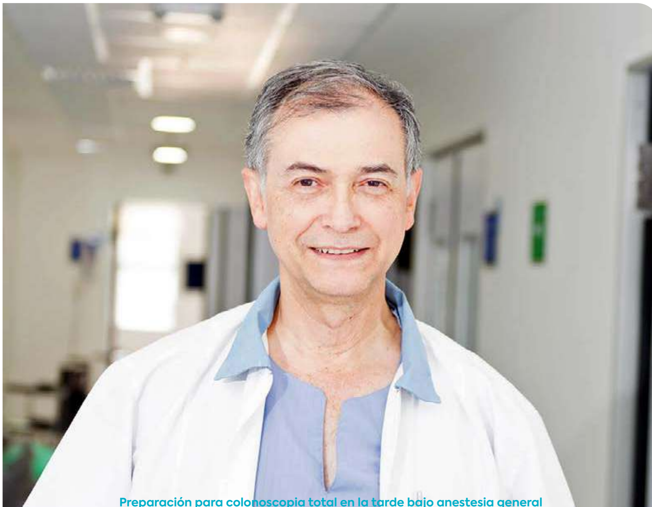
Preparación para colonoscopia total en la tarde bajo anestesia general